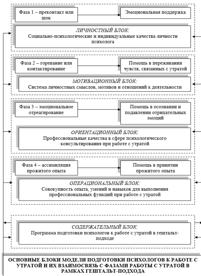
Рис. 1. Взаимосвязь фаз работы с утратой в контексте гештальт-подхода и блоков модели подготовки психологов в сфере психологического консультирования при работе с утратой

На стадии эмоционального отреагирования у человека происходит переживание траура, выражение в деятельности преобладающих эмоций к умершему. Именно поэтому задачей специалиста-психолога становится оказание помощи в подавлении эмоций отрицательного характера. Для решения данной задачи требуется наличие у психолога совокупности умений профессионального характера, которые составляют ориентационный блок.