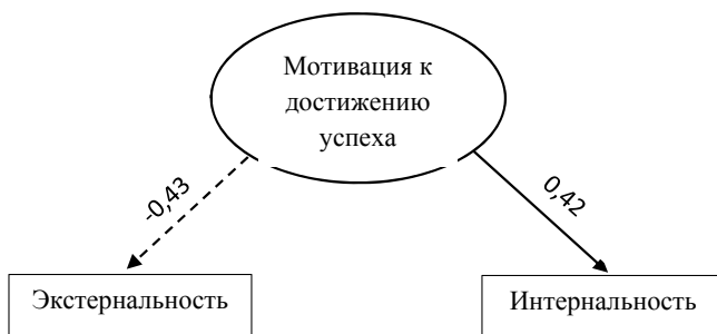
Рис. 3. Результаты применения непараметрического критерия ранговой корреляции г-Спирмена

нее мотивированные на успех испытуемые обладают интернальной локализацией контроля. Для иллюстрации статистически значимых взаимосвязей была построена корреляционная плеяда (рис. 3).